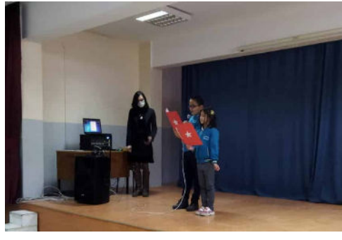
18 Mart Çanakkale Şehitlerini Anma günü.