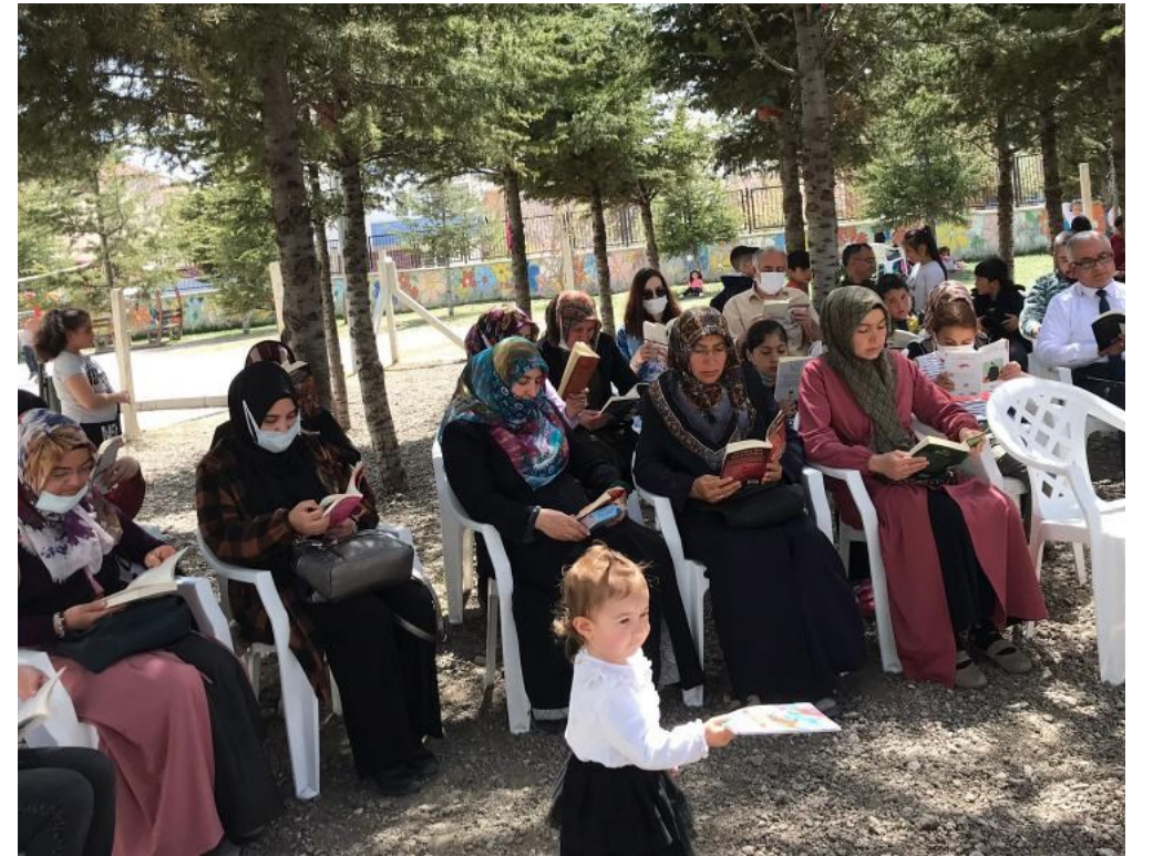
Velilerimizle birlikte okul bahçemizde kitap okuma etkinliği düzenledik.