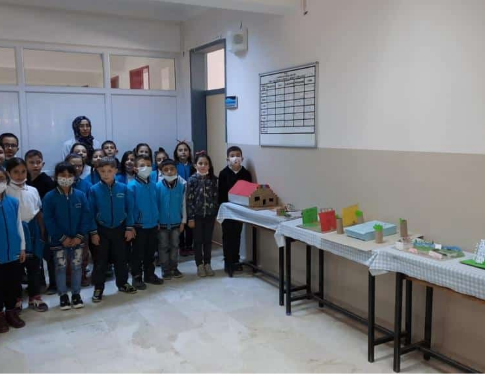
3/A Sınıfı Doğal Çevre-Yapay Çevre etkinlikleri okul koridorumuzda sergilendi.