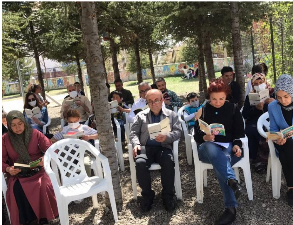
Hep Birlikte Kitap Okuyoruz.