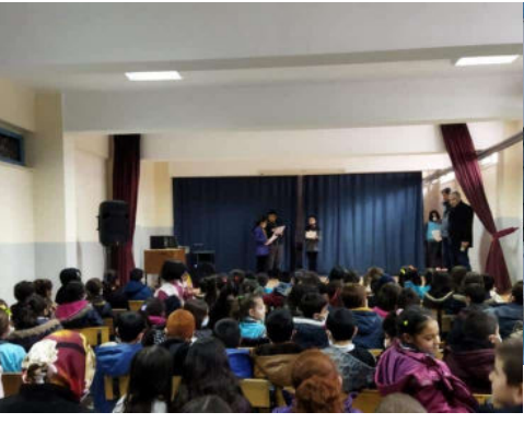
12 Mart İstiklal Marşı'mızın Kabulü okulumuzda coşkuyla