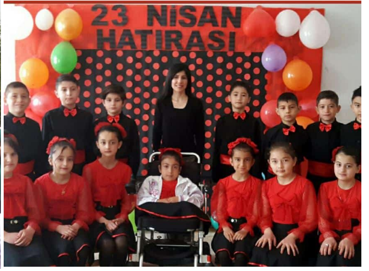
23 NİSAN ULUSAL EGEMENLİK VE ÇOCUK BAYRAMI COŞKU İLE KUTLANDI.