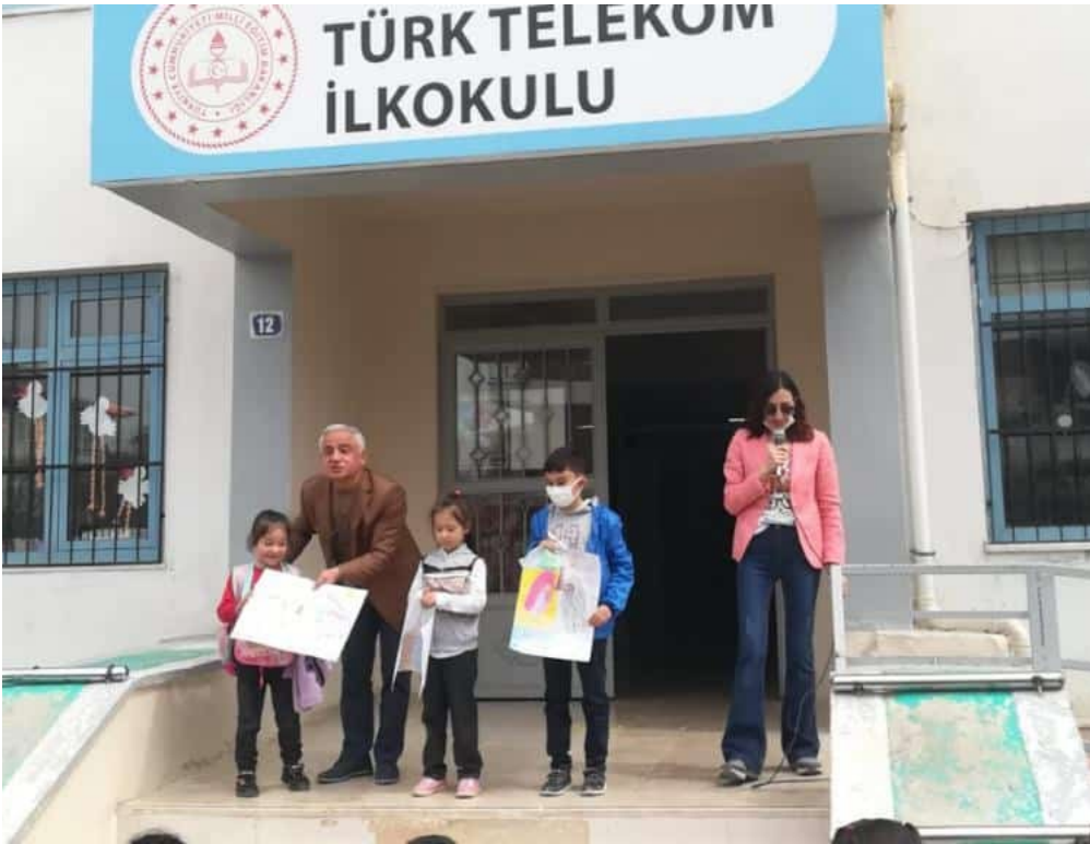
"Geleceğimiz Temiz Hava Temiz Su" konulu resim yarışması yapıldı. Yarışmada dereceye giren öğrencilerimize ödülleri verildi.