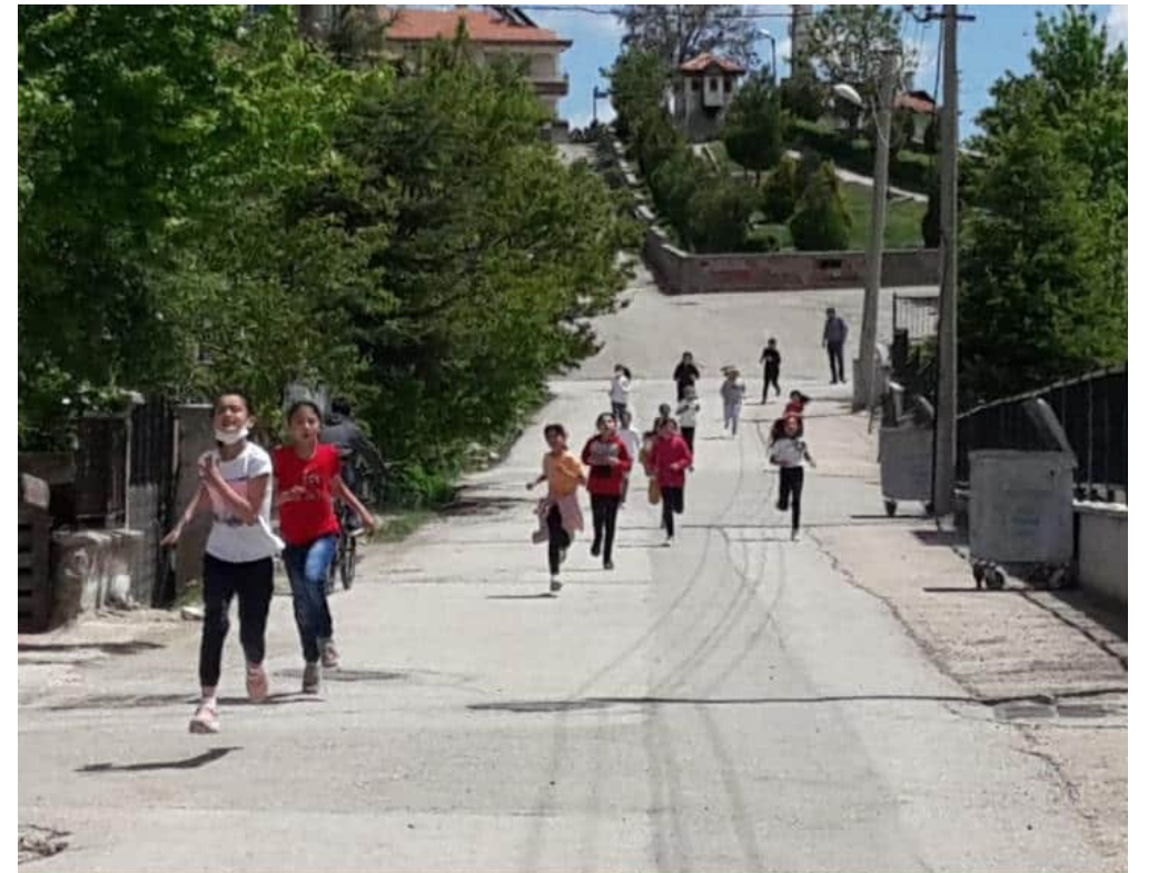
4.sınıflarımız arasında koşu yarışması düzenlendi.