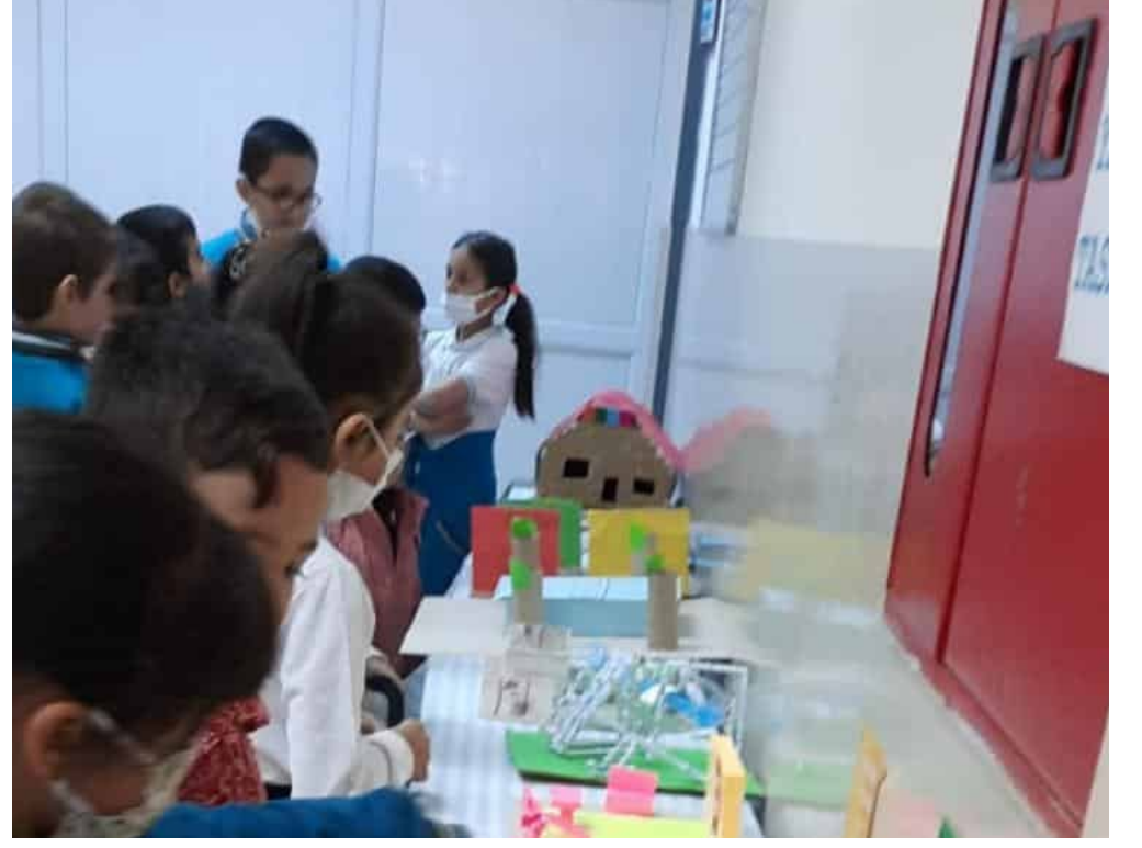
Sergiye tüm öğrencilerimiz ziyaret ederek incelediler, konu hakkında bilgilendiler.